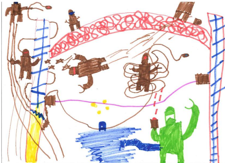
„Stadt der Ninjas“ von Django

Art Director: Samuel Müller-Späth (Erzieherpraktikant)