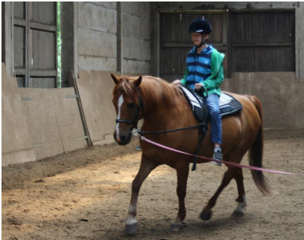
Diango auf Diango ☺