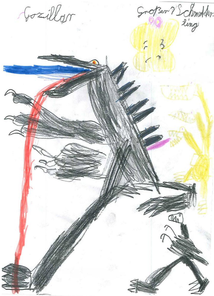
„Gozillar & Großer Schmetterling“ von Scott