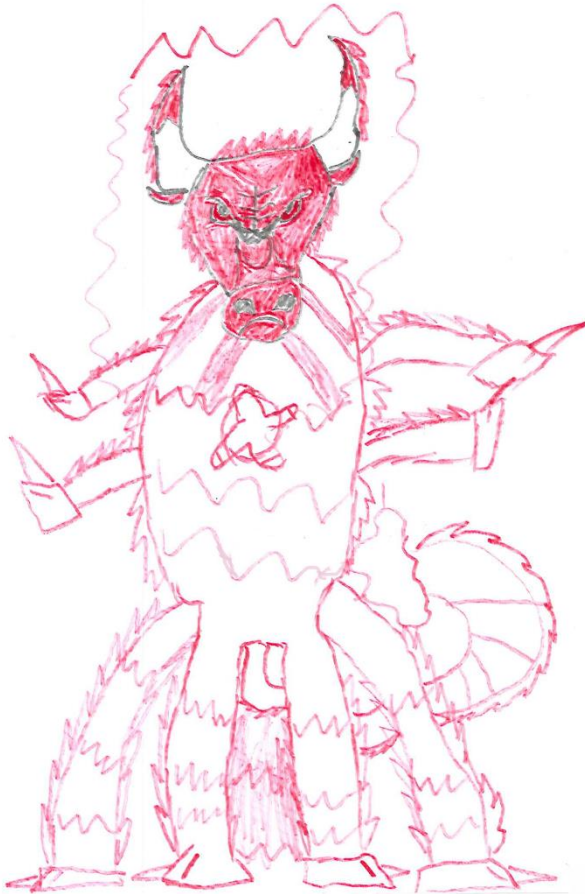
„Monsterbulle“ von Bright